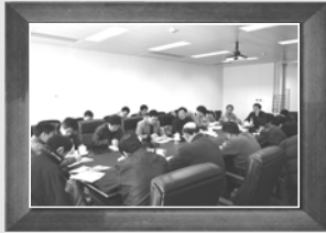
▲3月14日第二次编委会会议,上海有色金属现货交易中心,审议大纲内容