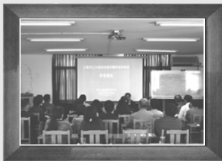
▲5月7日第四次编委会会议,上海市工业经济管理进修学院, JJ小组活动知识培训并落实优秀案例