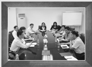
▶6月8日第五次编委会会议,上海龙阳精密复合铜管有限公司,确定编写进度并交流编写难点