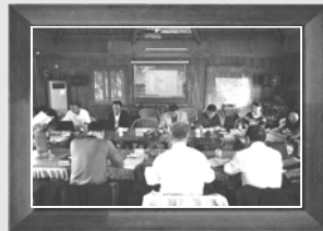
▲11月1日-2日第八次编委会会议,金山张堰镇,修改审核各章节内容并精简提炼