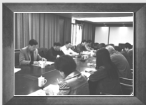
▲4月16日第三次编委会会议,上海市经济团体联合会,确定大纲和各章节要点