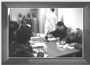
▲2月25日第一次编委会会议,上海有色金属工业技术监测中心宝山实验室,确定编写提纲并成立编委会小组