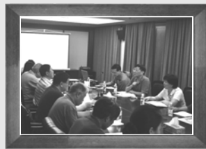
▲7月18日第六次编委会会议,上海市经济团体联合会,交流各章节编写情况

春去冬来,协会在2013年初春之际组织各方力量开始撰写的《节能减排(JJ)小组活动丛书——有色金属行业篇》终于付梓问世。该书凝聚了行业内众多专家、编委的智慧与辛勤汗水。编委们在历经4个月的前期调研和资料收集,6个多月的内容撰写、修改、研讨,3易提纲、3次提炼,召开了9次编委会工作会议,终于完成了编辑任务。期间遭遇百年一遇的高温,其中艰辛,一言难尽。谨以此影集回顾那段艰辛却又意义深远的历程,并向编委们的辛勤付出致以崇高敬意。