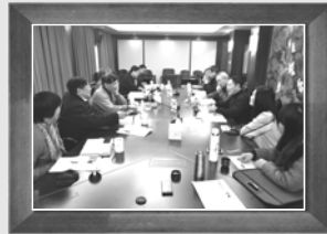
▲12月11日第九次编委会会议,上海市经济团体联合会,通过专家审定