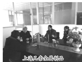
上海凡索金属制品