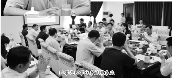
理事或理事代表鼓掌表决

本报讯 2011年6月24日，上海有色金属行业协会三届三次理事会在松江香薇玫瑰庄园顺利召开。协会31位理事中共有26位理事或理事代表出席了会议，超过了总人数的2/3。